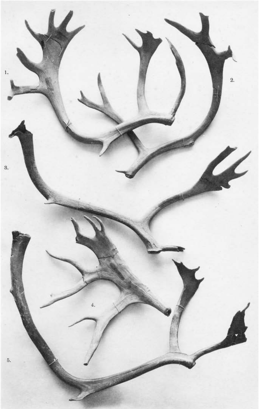
RANGIFER TARANDUS FRA DANMARK.