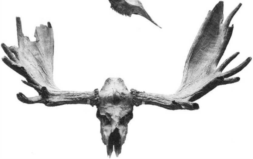
ALCES MACHLIS FRA DANMARK.