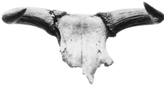
BOS TAURUS URUS FRA DANMARK.