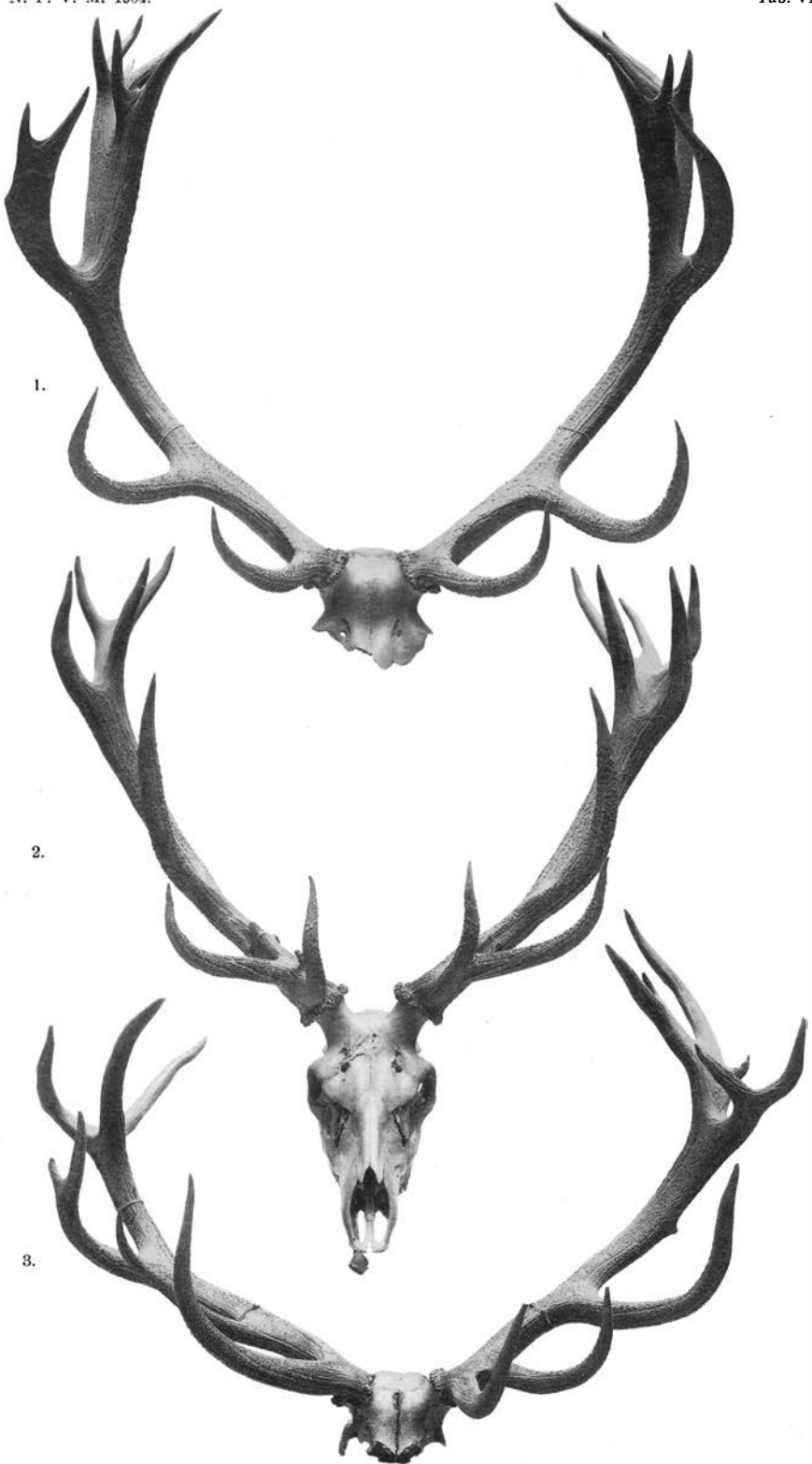
CERVUS ELAPHUS FRA DANMARK.