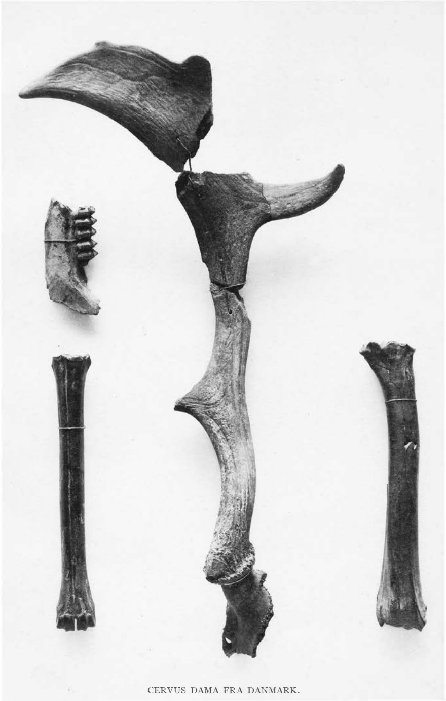
CERVUS DAMA FRA DANMARK.